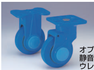
オプション仕様の 静音 ® ウレタンタイヤ