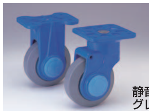
静音 ® グレータイヤ