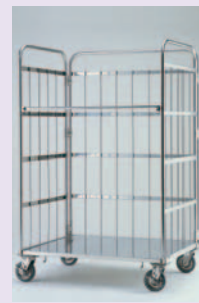
▲オールステンレス仕様