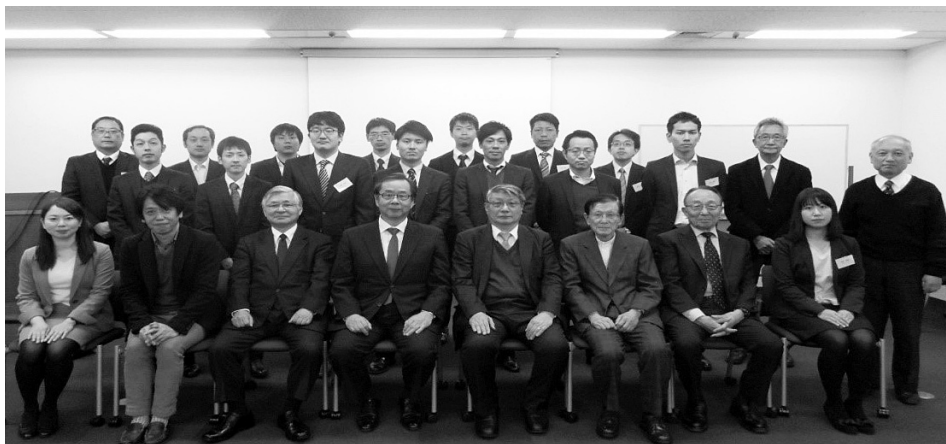
受講者記念写真 修了式において

キルや現場運用のノウハウを身に付けたプロフェッショナルを養成する我が国唯一の実践講座である。今期は、新たに16名の受講者がMH技術管理士としての知識を修得した。