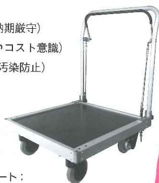
「軽銀カート： AL600 X 600-DB」