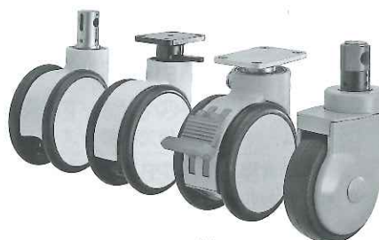
CareFree Casters 製品

アブレン」を採用し、静かさと安定した走行性を実現。従来のゴム車輪と比べて転がり抵抗を1/3に低減している。