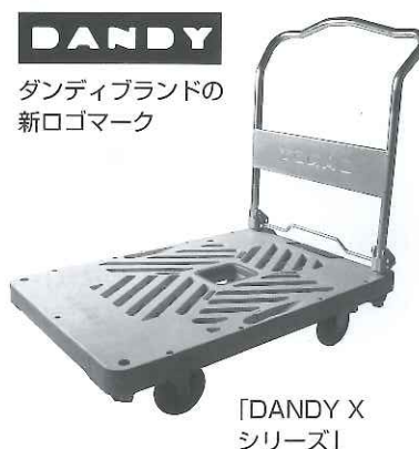
DANDY ダンディブランドの 新ロゴマーク

同社は昨年10月から、機能性とデザイン性を強化した樹脂製手押し台車の新製品「DANDY Xシリーズ」の販売を開始。これに伴い、新たなブランディング戦略として、ロゴマークの刷新も進めており、今回の取り組みはその一環となる。